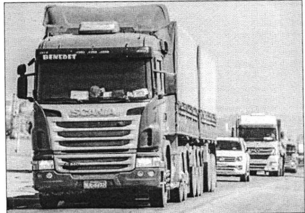
Além de absorver as altas, transportadores não estão conseguindo o 'frete retorno' para compensar as viagens de volta

que o setor não consegue mais absorver os aumentos nos custos operacionais. "A recomposição do preço do frete se justifica para evitar o colapso de inúmeras empresas transportadoras que, antes mesmo desse novo reajuste, já vinham negociando com os seus clientes o repasse de quase 50% de aumento no diesel registrado em 2021. Caso não haja o repasse imediato, a operação de transporte corre o risco de se tornar inviável", diz a CNT. Somente em 2021, a Petrobras praticou 11 reajustes no preço do diesel. Nas refinarias, esse aumento foi de 64%, enquanto nos postos a alta ficou em torno de 50%, devido à mistura com biodiesel. Portanto, o setor ainda tentava recompor as perdas do ano passado quando foi surpreendido pelo novo aumento. Como possível solução para os aumentos inesperados, provocados por questões especulativas e redução da oferta do produto no mundo, Eleus defende o fim